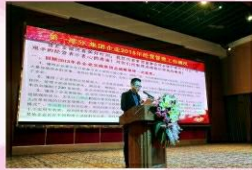
集团总裁作年会报告