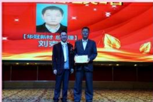
颁发企业优秀管理奖