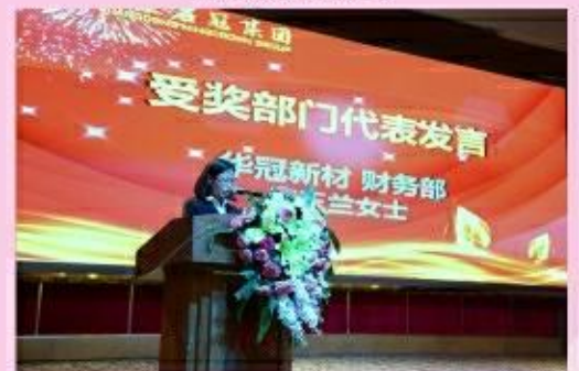
受奖部门代表发言