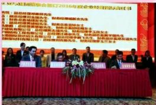
签订2016年企业经营指标责任书