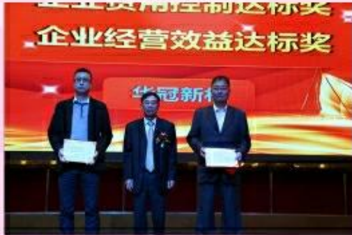
企业经营效益达标奖