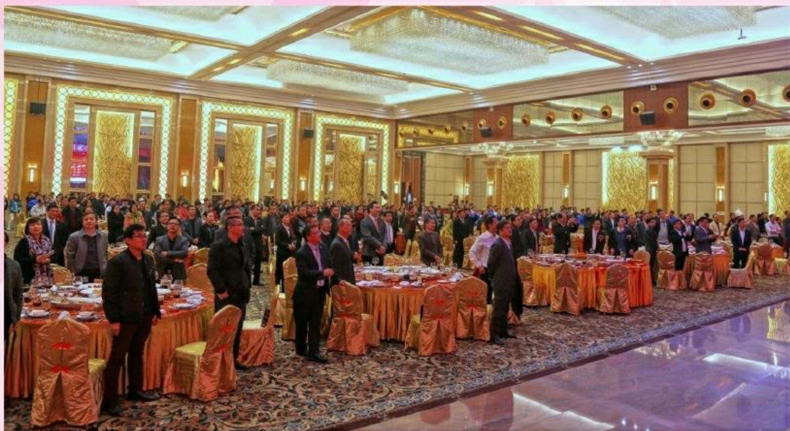
■ 图注：名冠人高唱《名冠之歌》