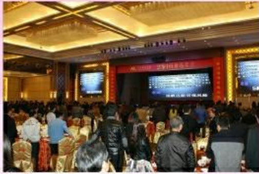
四百多人齐聚一堂