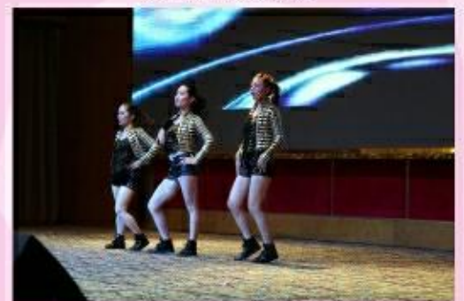
华宇钢构 舞动青春