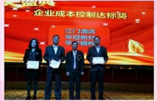
颁发企业成本控制达标奖