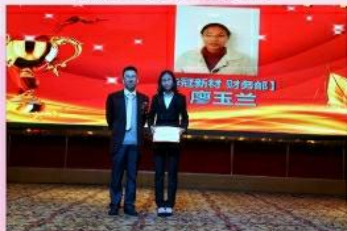
颁发优秀部门管理奖