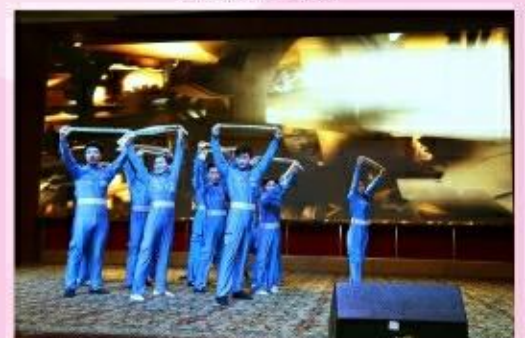
我们是快乐的建筑工