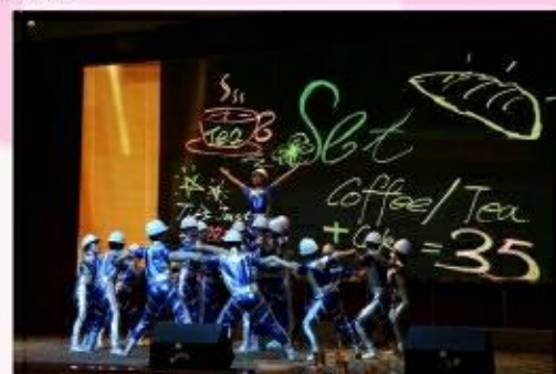
华冠新材 青春·梦想·未来