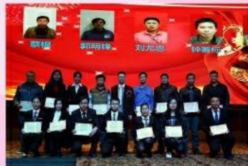
颁发优秀基层管理奖