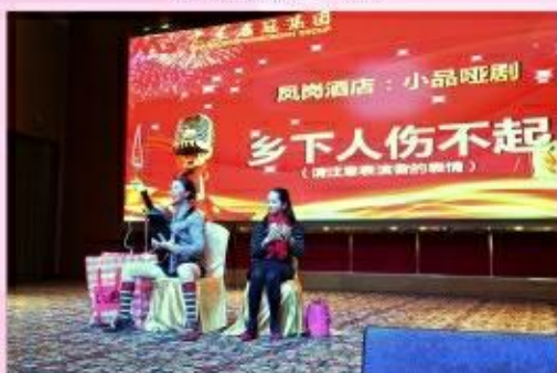
凤岗酒店 乡下人伤不起