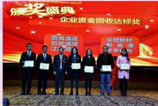
颁发企业资金回收达标奖