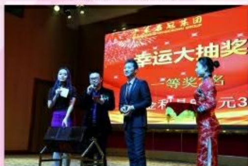
激动人心的时刻到了