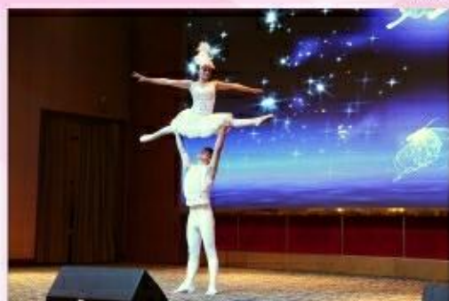
嘉宾表演 肩上芭蕾