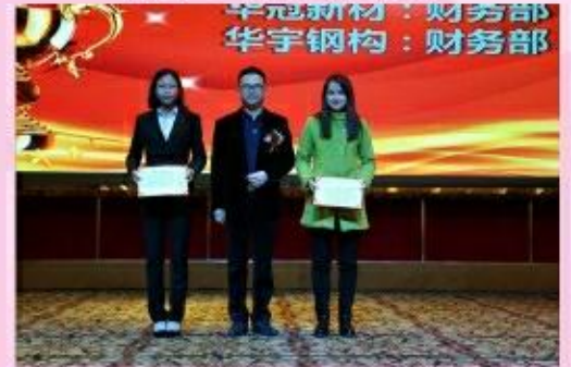
颁发企业优秀部门奖